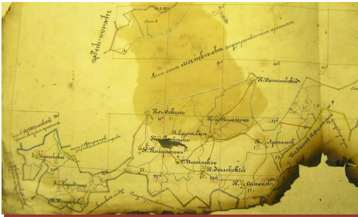
1865 г. – Сборный лист планшетам по даче с Ильинского с деревнями Матвеевской волости Кологривского уезда владения государственных крестьян (ГАКО, ф. 138, оп.23 (3 вн.), д. 151)

По состоянию на 1907 г. в составе Матвеевской волости насчитывалось 43 населенных пункта, среди крестьян которых был развит плотничный промысел, связанный с отходничеством.